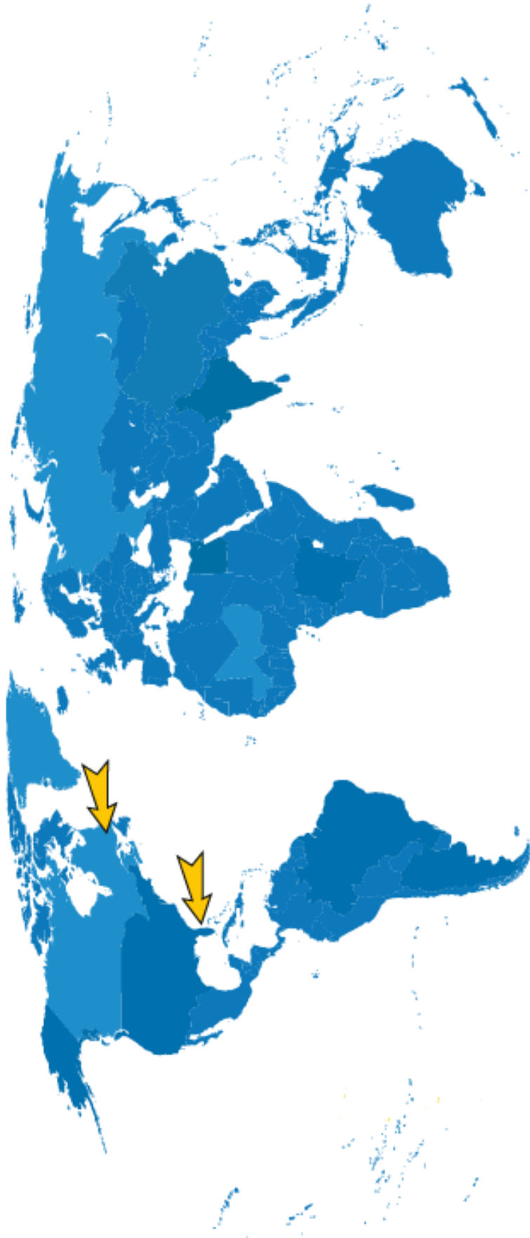
Carte du monde